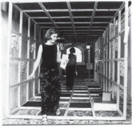
Sortant du Couloir miné avec sa feuille d'aventure, une visiteuse découvre les douze situations de "violence ordinaire" proposées par tirage au sort.