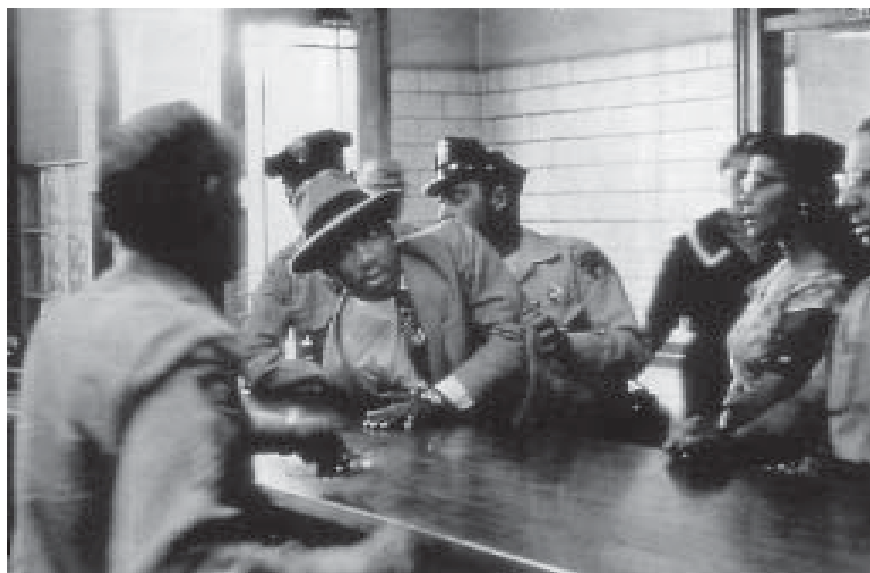
M. L. King arrêté à Montgomery, Alabama, en septembre 1958. Coretta King est à droite.

Quelle est la place de la médiation dans notre société ? Les auteurs de ce petit livre s'intéressent au long terme et à la dimension politique, étudiant la médiation dans un "ensemble plus vaste [...] analysé à travers les transformations du