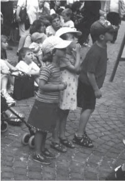
Dans la foule des fans de Jacky Lager, Riri, Fifi et Loulou étaient aussi de la fête le 24 mai sur la Place de la Palud !