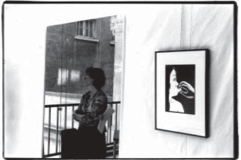
La visiteuse découvre ensuite les bases d'une communication respectueuse de soi-même et d'autrui : savoir écouter avec empathie, oser s'affirmer sans entrer en compétition.

Des jeux-tests visuels et auditifs lui permettent de tester sa capacité de décoder les messages corporels, les petites nuances dans la voix qui, au-delà du verbal, au-delà du contenu d'un message, sont révélatrices d'émotions profondes.