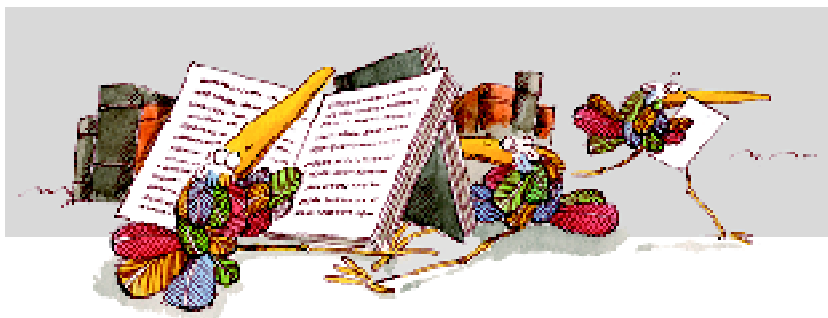
Illustration tirée du nouveau dépliant du CMLK