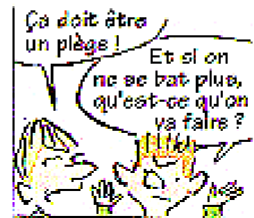
Dessin Serge Bloch "Max se bagarre"