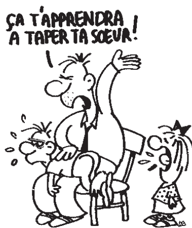
Dessins d'Antoine Chéreau, tirés de "Mange ta soupe et... tais-toi!"